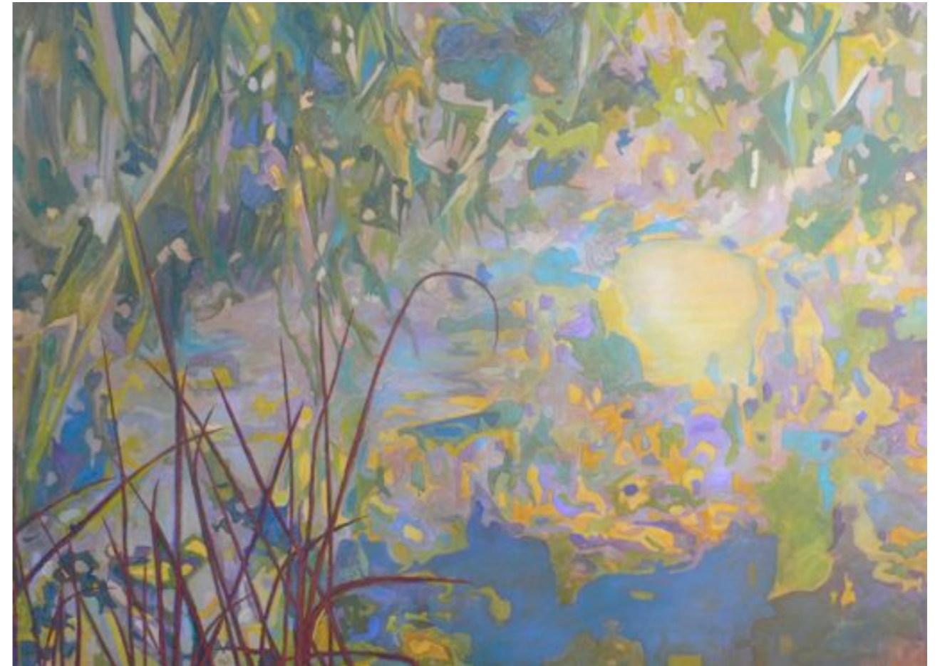
Contraportada OPHELIA'S LAKE Portada OPHELIA'S SUNNY LAKE 2014. Oli / tela. 97 x 130 cm